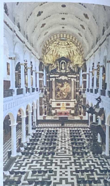
De Sint-Carolus Borromeuskerk in Antwerpen.